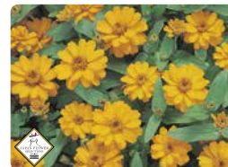
プロフュージョン ダブル ゴールデン