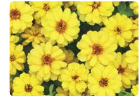
プロフュージョン ダブル イエロー