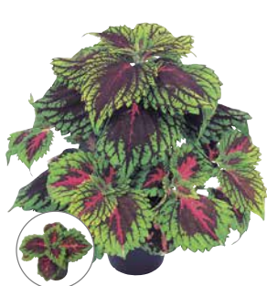
ゴリラ サーモンピンク