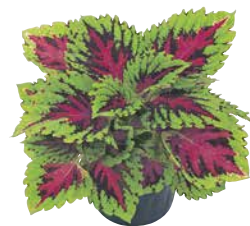
ゴリラJr. ウォーターメロン