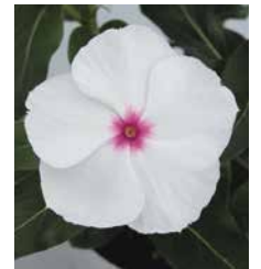
サンダー ポルカドット