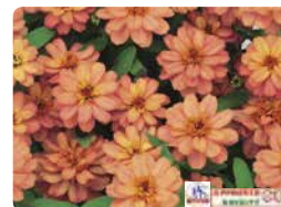
プロフュージョン ダブル ディープサーモン