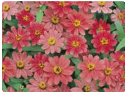
プロフュージョン コーラルピンク