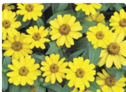
プロフュージョン イエロー