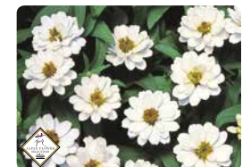
プロフュージョン ダブル ホワイト