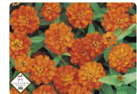
プロフュージョン ダブル ファイアー