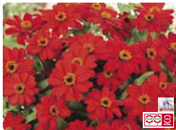
プロフュージョン レッド