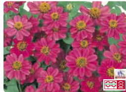
プロフュージョン チェリー