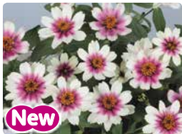
プロフュージョン チェリーパイカラー