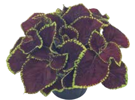
ゴリラJr. ガーネット