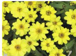
プロフュージョン レモン