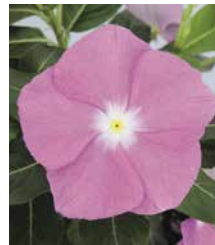
サンダー ディーブラベンダー