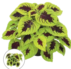
ゴリラ ライムスプライト