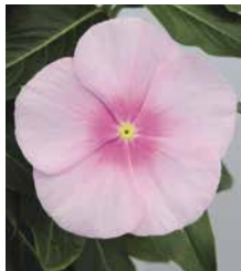
サンダー アイシーピンク