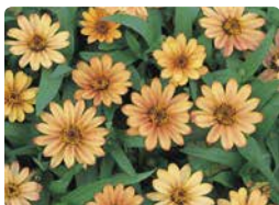
プロフュージョン アプリコット