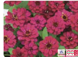
プロフュージョン ダブル ホットチェリー