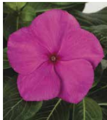
サンダー グレープ