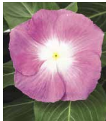
サンダー オーキッドハロー