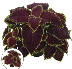
ゴリラ スカーレット (ver. 2)