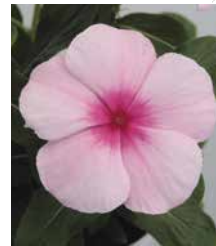
サンダー ストロベリー