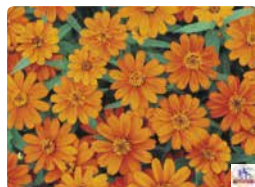
プロフュージョン オレンジ