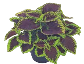
ゴリラJr. ライムペイン

HP サカタのタネホームページ「商品いろいろ検索」に詳しい説明が掲載されています。