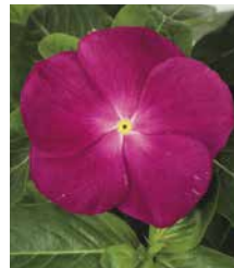
サンダー ラズベリー