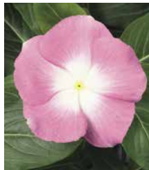
サンダー ピンクハロー