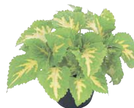
ゴリラJr. グリーンハロー