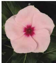
サンダー アプリコット