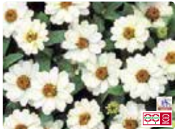
プロフュージョン ホワイト