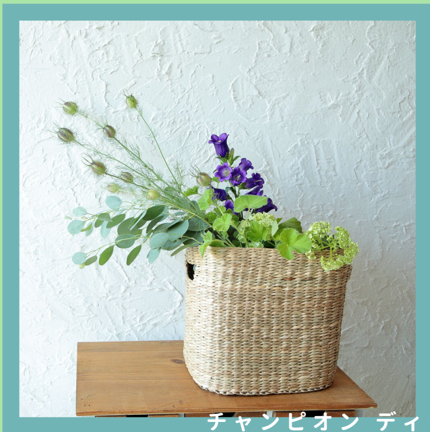
チャンピオン ディープブルー