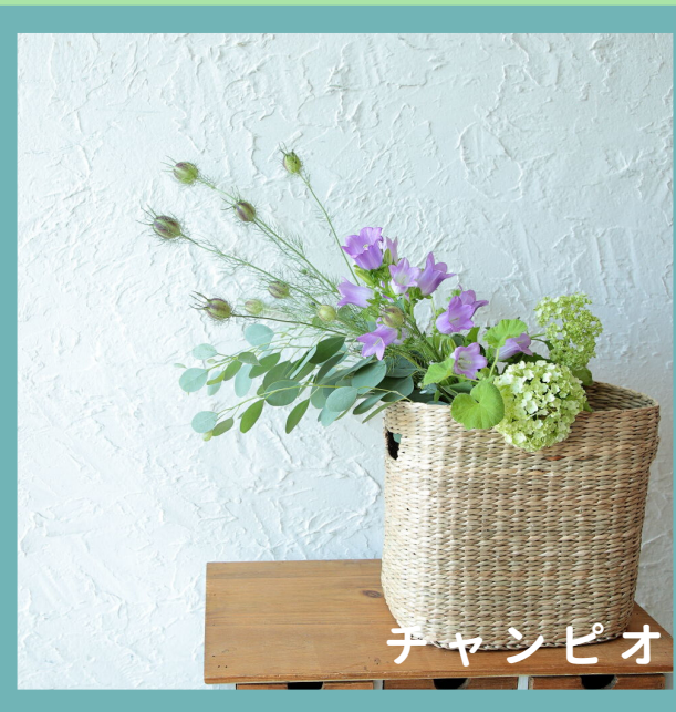
チャンピオン ライラック