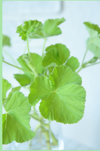
グリーンフレーク ゼラニウム