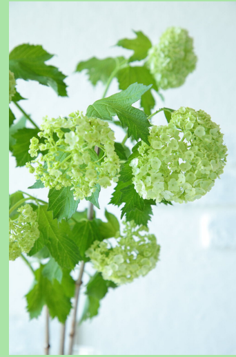
ビバーナム スノーボール