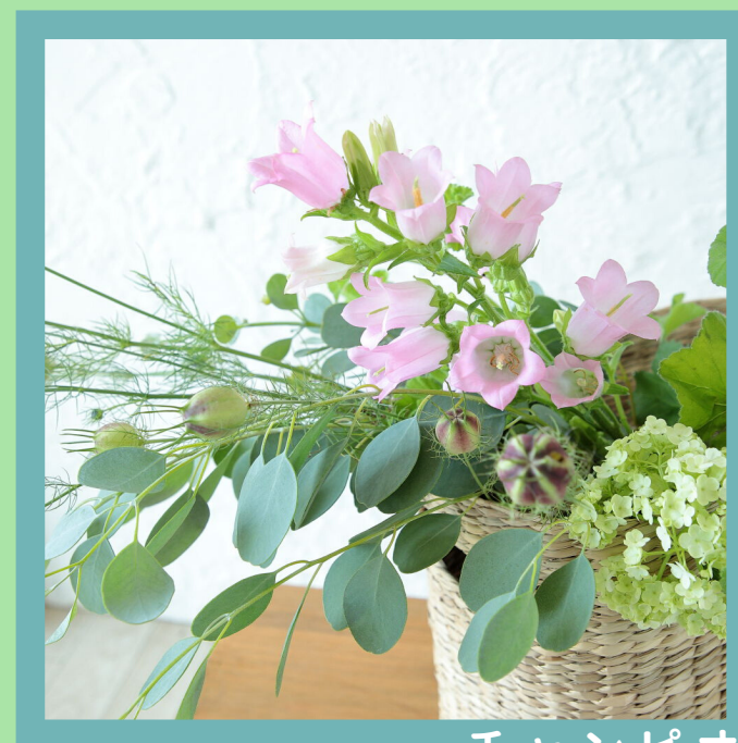
チャンピオン ピンク