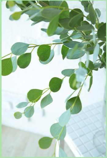
ユーカリ ポポラス