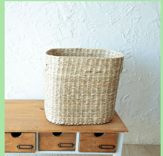
収納用のバスケット